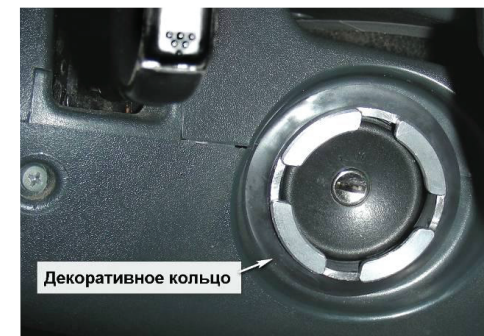
3.11. На фланец «Защиты корпуса» установите декоративное кольцо, таким образом, чтобы оно закрывало крепежные винты. Проведите проверку работоспособности «Гарант Panzer», путем установки «Защиты механизма секретов» на фланец «Защиты корпуса». При необходимости произведите регулировку положения кожуха рулевой колонки.