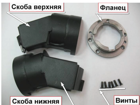
3.4. Распакуйте «Гарант Panzer», открутите винты и демонтируйте фланец с верхней и нижней скоб.