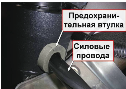
3.7. Уложите силовые провода штатного замка зажигания в втулку предохранительную, установленную в корпус скобы.