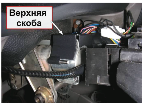
3.5. Поверх штатного замка зажигания установите верхнюю скобу.

3.2. Отключите массовую клемму аккумулятора.