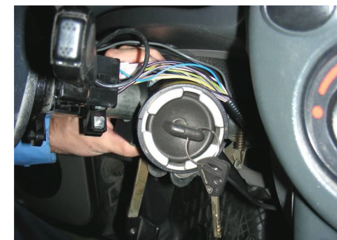
3.9. Подключите массовую клемму аккумулятора. Произведите проверку работоспособности устройства «Гарант Panzer» и штатного замка зажигания с электрооборудованием автомобиля, в том числе с системой АПС-6 - запуском двигателя.

Убедитесь в отсутствии пережатий и повреждений силовых проводов штатного замка зажигания. При возникновении пережатий и повреждений силовых проводов возможно короткое замыкание!