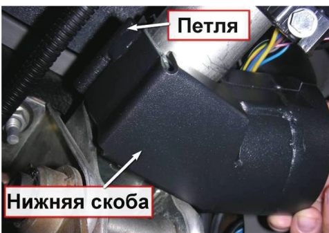
3.6. Установите нижнюю скобу, соединив ее с верхней скобой посредством петли.