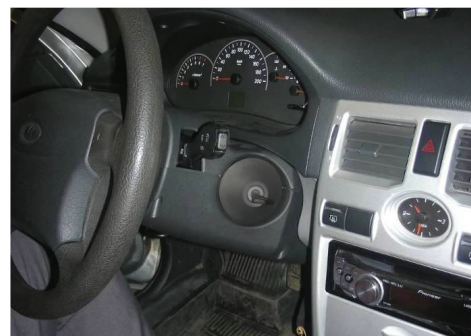
3.10. Заглушите двигатель автомобиля. Установите на место кожух рулевой колонки, сцентрировав его относительно установленной «Защиты корпуса». Проведите повторную проверку работоспособности штатного замка зажигания.