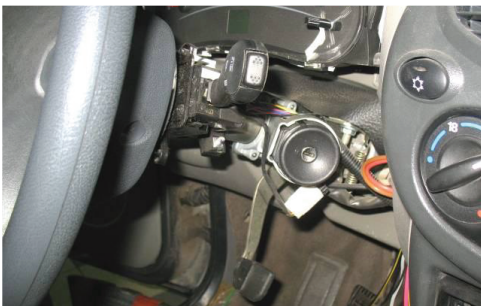
3.3. Демонтируйте пластмассовый кожух рулевой колонки.