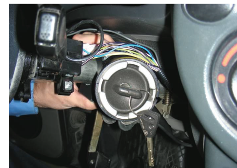
3.9. Подключите массовую клемму аккумулятора. Произведите проверку работоспособности устройства «Гарант Panzer» и штатного замка зажигания с электрооборудованием автомобиля, в том числе с системой АПС-6 - запуском двигателя.

Убедитесь в отсутствии пережатий и повреждений силовых проводов штатного замка зажигания. При возникновении пережатий и повреждений силовых проводов возможно короткое замыкание!