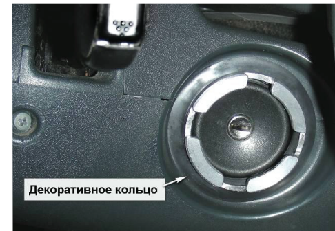
3.11. На фланец «Защиты корпуса» установите декоративное кольцо, таким образом, чтобы оно закрывало крепежные винты. Проведите проверку работоспособности «Гарант Panzer», путем установки «Защиты механизма секретов» на фланец «Защиты корпуса». При необходимости произведите регулировку положения кожуха рулевой колонки.