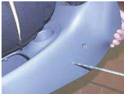
Фото № 14