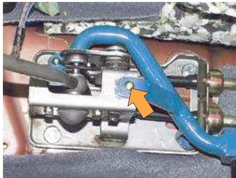
Фото № 10