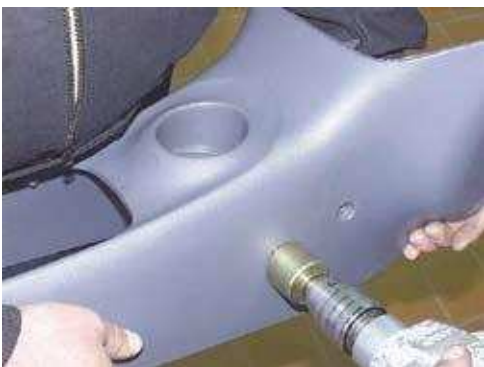
Фото № 15