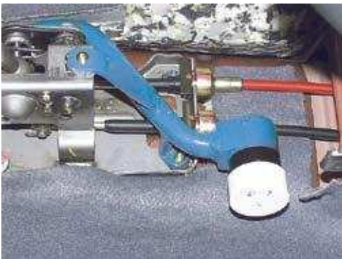
Фото № 13