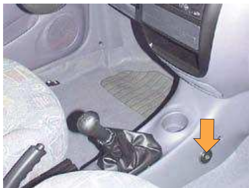
Фото № 16