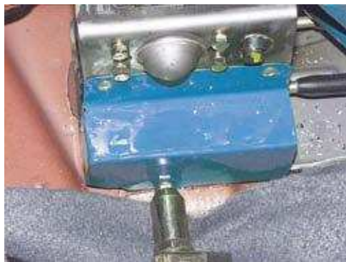
Фото № 12