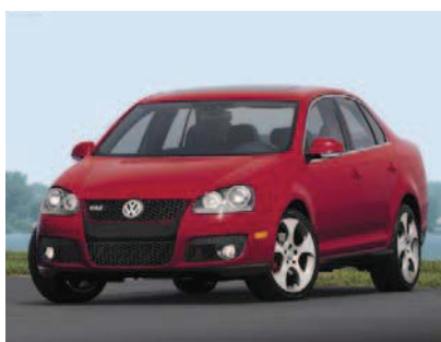
Автомобиль VW JETTA