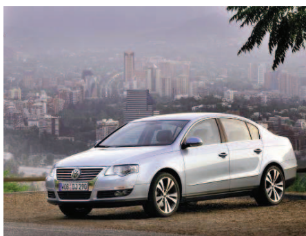
Автомобиль VW PASSAT B6