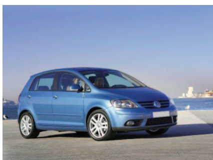
Автомобиль VW GOLF PLUS