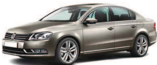
Автомобиль VW PASSAT B7