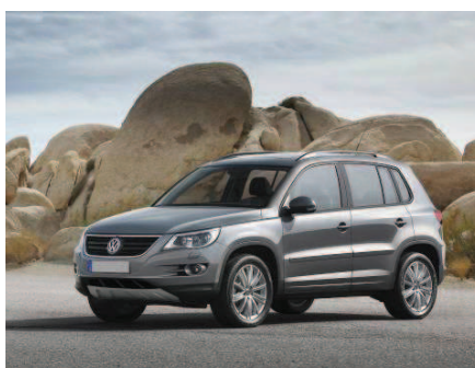
Автомобиль VW TIGUAN