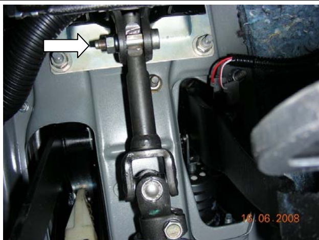
Фото №3 (р.в. а/м «LADA PRIORA/BA3-2172» * /07-/ * ГУР)