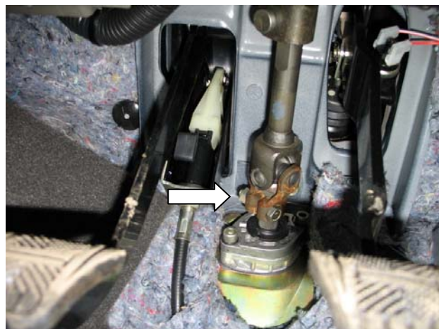
Фото №2 (р.в. а/м «LADA PRIORA» * /07-/ * ЭлУР)